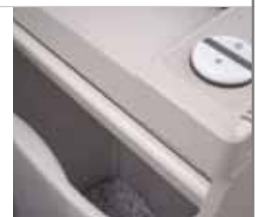
Volet de sécurité électronique