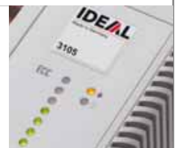
Contrôle de capacité