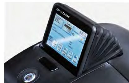
Écran tactile inclinable