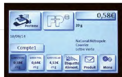
Gestion des empreintes publicitaires